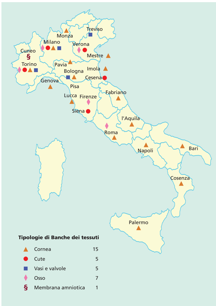
Figura 3. Banche dei tessuti in Italia.

Le norme europee e italiane hanno poi stabilito i criteri di organizzazione delle banche tessuti, dettando regole comuni in Europa per ciascuna fase del processo dalla donazione, alla raccolta/prelievo, lavorazione, conservazione e distribuzione di tessuti e cellule e attribuendo alle autorità competenti di ciascun Stato Membro la responsabilità di verificarne l'applicazione. Il Centro Nazionale Trapianti è una delle autorità competenti che hanno il compito in Italia di garantire l'applicazione della Direttiva Europea. A questo scopo ha sviluppato dal 2004 in Italia un programma sperimentale, tra i primi in Europa, di ispezioni alle banche dei tessuti italiane.